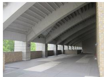
雨天時の昼食は当館軒下、冬季は研修室等になります