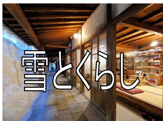
昭和 30 年代の上越市高田の雁木通りを実物大のジオラマで復元