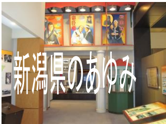
新潟県の先人たちの姿を、古い時代から新しい時代へと時代に沿って紹介