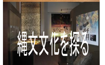
春夏秋冬の縄文時代の様子を実物大のジオラマで復元