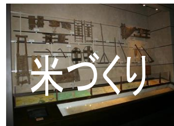
全国有数の米どころを実現させた人びとの努力の様子を紹介